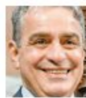
André Ceciliano deputado estadual do PT e presidente da Alerj

Vivemos em meio a uma difícil realidade, agravada pelo prolongamento da pandemia de coronavírus, que tem provocado duros reflexos na sociedade não somente no tocante à saúde e à preservação da vida, nosso bem maior. O crescimento exponencial do desemprego no país, em especial no Rio de Janeiro, é uma consequência desse cenário e vem lançando à linha da pobreza diversas famílias, numa espécie de migração perversa.