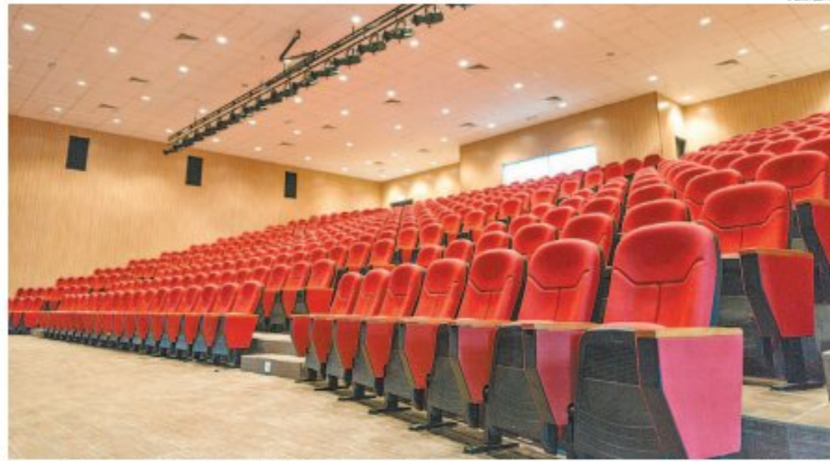
Segundo estudo do Sebrae, 98% dos eventos foram cancelados de março a dezembro de 2020

O setor de eventos do Rio de Janeiro e do Brasil está desesperado. O colapso nesta área, tão vital para a indústria do entretenimento e difusão de alegria, chegou antes mesmo da crise nos hospitais. A pandemia só agravou o que já estava difícil. São milhares de desempregados que totalizam quase 80 fábricas da Ford. Um estudo do Sebrae detectou que o setor de eventos teve um prejuízo de R$ 270 bilhões, de março a dezembro de 2020, devido ao descontrole no combate ao coronavírus. De acordo com o estudo, 98% dos eventos foram cancelados e mais de 600 mil empresas e dois milhões de MEI viram da noite para o dia os seus trabalhos desaparecerem. Também foi ressaltado que esse segmento representa 3% do PIB do país e que empresários apoiam projeto de lei que tramita na Câmara dos Deputados voltado para amparar esse segmento.