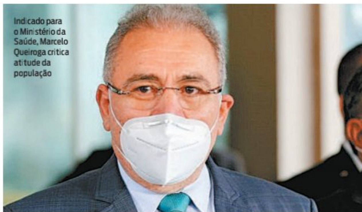
Indicado para o Ministério da Saúde, Marcelo Queiroga critica atitude da população

Queiroga também indicou que trabalhará para um "grande diálogo nacional" com estados, municípios e a sociedade civil, falou em "política de distanciamento social inteligente" e repetiu que "governo federal e nem governo nenhum tem uma vara de condão para resolver