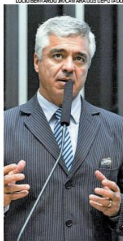
Major Olimpio: ex-PM e político

Além dele, até o momento, outros dois senadores morreram em decorrência da doença: José Maranhão (MDB-PB) e Arolde de Oliveira (PSD-RJ). Já Alessandro Vieira (Cidadania-SE) e Lasier Martins (Podemos-RS) seguem internados por causa da doença.