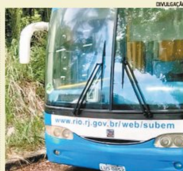
'Castramóvel' está parado há 15 dias