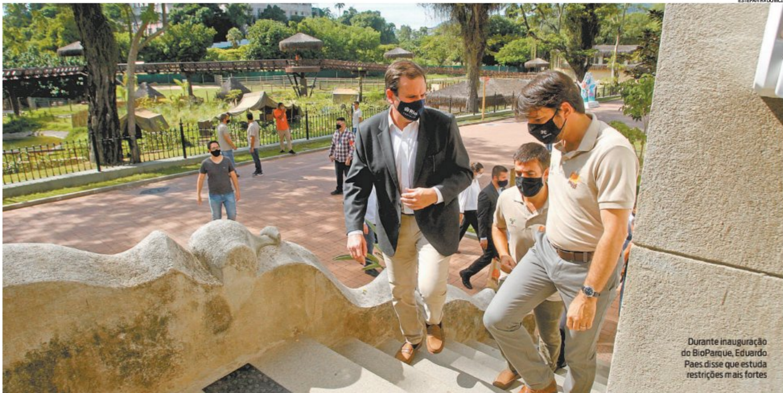
Durante inauguração do BioParque, Eduardo Paes disse que estuda restrições mais fortes

Eduardo Paes admite endurecer medidas restritivas na cidade, adotar barreiras sanitárias e antecipar feriados de abril