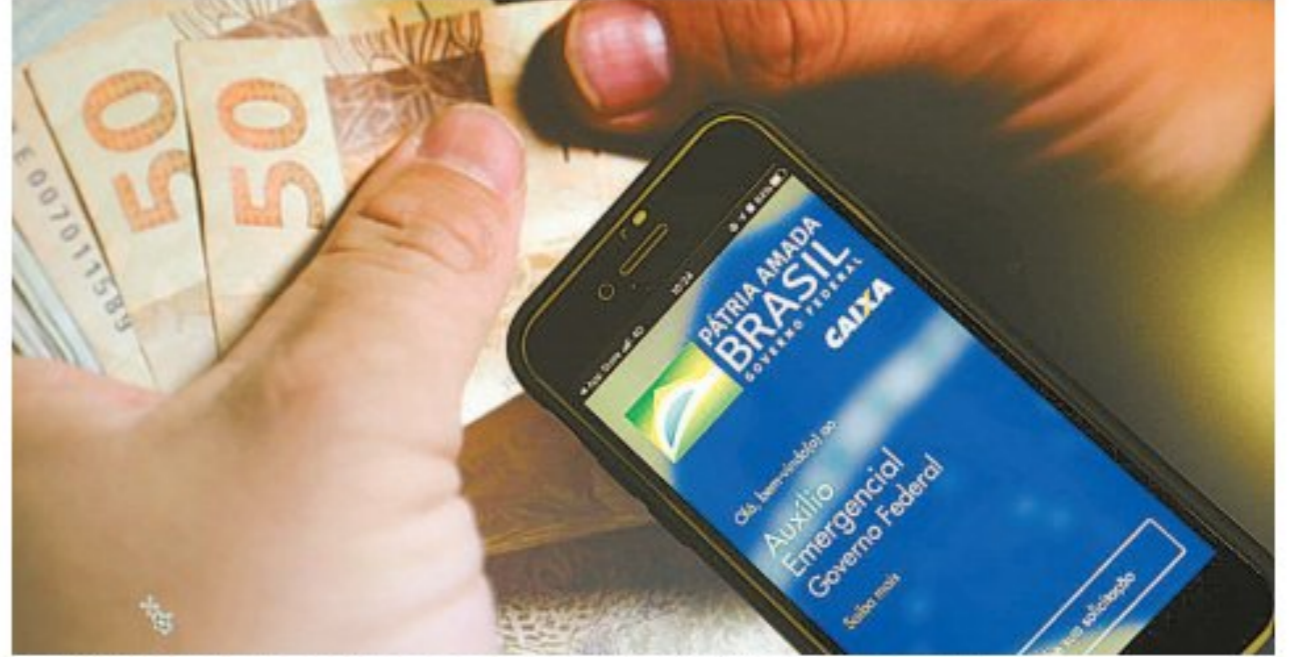
Beneficiários poderão movimentar os recursos pelo aplicativo da Caixa no celular

Os integrantes do Bolsa Família serão contemplados com o benefício conforme o calendário habitual do programa, e os demais receberão na Conta Social Digital, que pode ser movimentada por um aplicativo de celular.